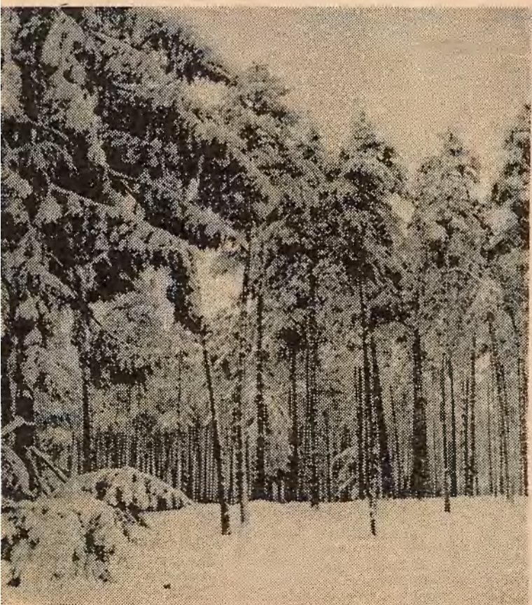
У САСНОВЫМ БАРЫ.